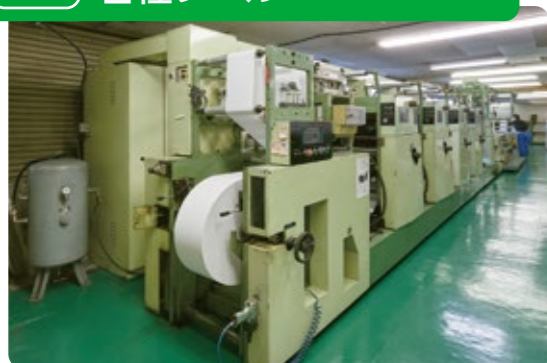
ビジネスフォーム印刷