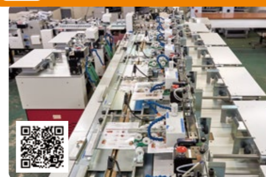
複数点の封入封緘作業。重量検査装置とカメラ検査装置にて誤封入と発送漏れを抑止。プライバシーマークも取得しておりますので、個人情報を厳重に取り扱います。