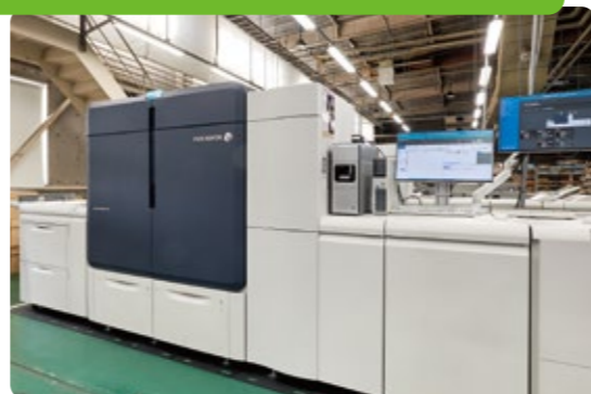
オンデマンド印刷